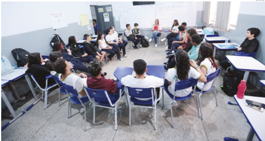
Formação continuada busca que professores fortaleçam vínculos e apoiem alunos em eus projetos de vida

A pesquisa “Harmonia transformadora: clima escolar, competências socioemocionais e o despertar do propósito dos estudantes” aponta, ainda, que uma estratégia para construção de projeto de vida precisa partir de um ambiente seguro, acolhedor e estimulante, com indivíduos psicologicamente fortalecidos. Os dados coletados em Goiás revelam uma correlação direta entre o clima escolar e os indicadores de