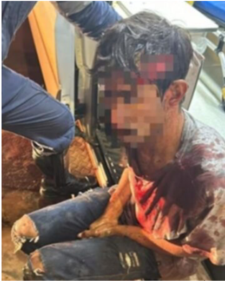
O ataque ocorreu na madrugada de 9 de janeiro, enquanto a vítima caminhava por um parque na cidade

A vítima, que sobreviveu ao ataque, está em recuperação e recebeu apoio de grupos comunitários e de direitos humanos. Seu caso não apenas destaca a vulnerabilidade dos praticantes de religiões de matriz africana, mas também serve como um chamado à ação para que episódios de intolerância religiosa sejam tratados com a seriedade e a urgência que merecem.