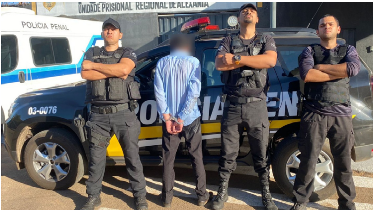
Suspeito foi capturado com a faca que teria sido utilizada no crime

indivíduo mantinham um relacionamento, segundo o suspeito preso. "No mo-