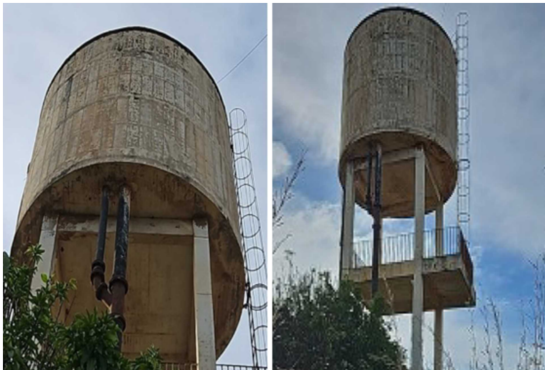
A situação no Jardim Bandeirantes começou a ser investigada em 2016, após notícias de que o abastecimento de água era realizado por uma empresa privada utilizando poços artesanais

Além disso, o MPGO exige a elaboração e submissão de um plano de amostragem para controle da qualidade da água para