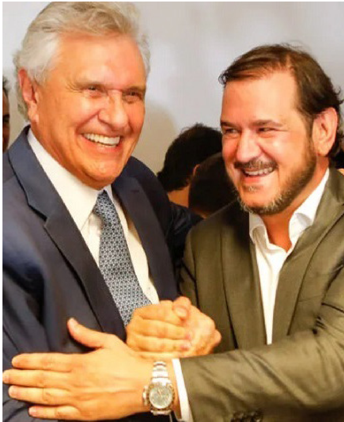
Ronaldo Caiado e Antonio Rueda: nome próprio do União Brasil à presidência da República

Em matéria intitulada “Quem será o nome forte da oposição em 2026? A corrida eleitoral já começou”, a revista discute sobre os movimentos dos principais atores da direita e que já são colocados como presidenciáveis. De acordo com a reportagem, cinco go-