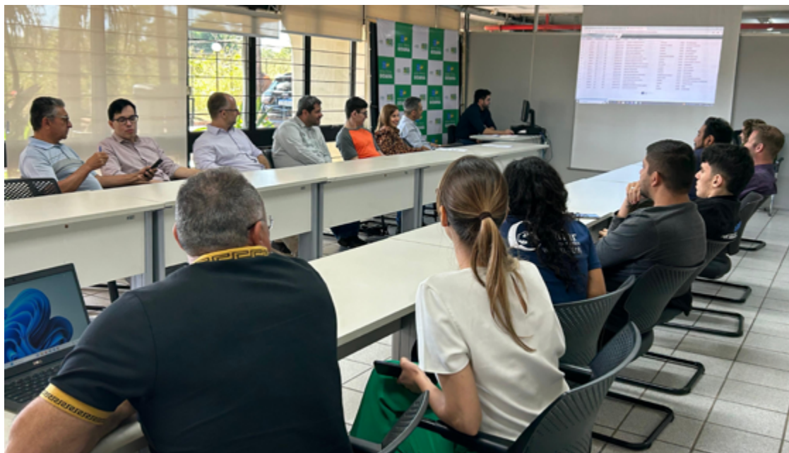
O sorteio, que é tradicionalmente realizado na última quinta-feira de cada mês, foi antecipado devido ao feriado de Corpus Christi

O sorteio, que é tradicionalmente realizado na última quinta-feira de cada mês, foi antecipado devido ao feriado de Corpus Christi. Além de Sulaine, outros 157