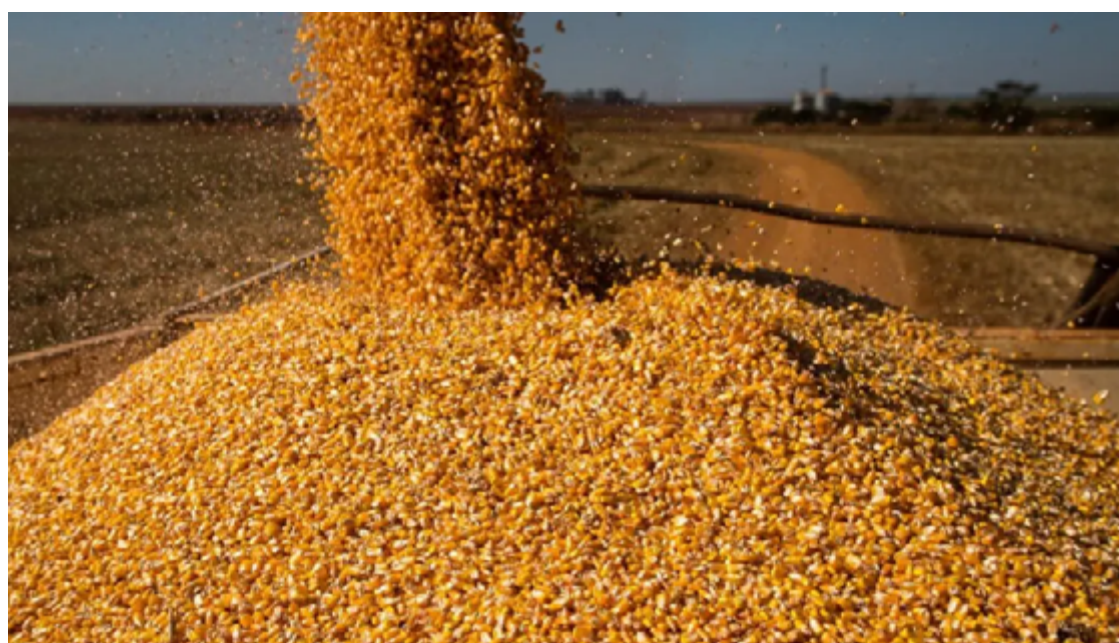
Cada produtor receberá até cinco sacos de 50kg de milho