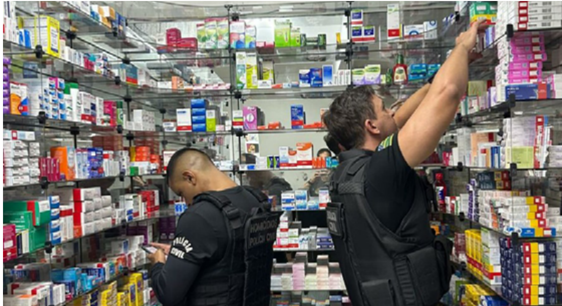
Os policiais destacaram que o farmacêutico fazia anamnese dos pacientes e utilizava carimbos e assinaturas falsificadas de médicos em suas receitas

ciais apreenderam uma grande quantidade de receituários em branco, documentos com carimbos e assinaturas falsificadas, e um carimbo com nome e registro profissional (CRM) de um médico. Nos computadores da farmácia, foram encontrados diversos modelos de receitas usadas nas falsificações.