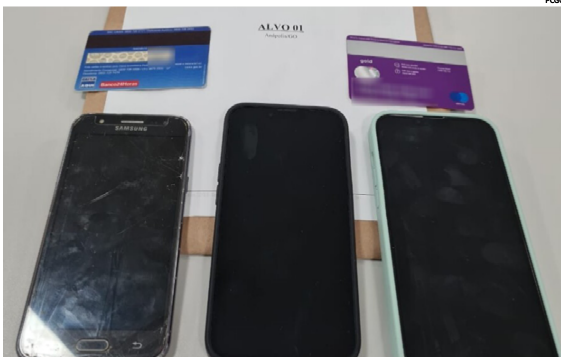
Durante as buscas, os policiais encontraram um chip de celular que foi utilizado para fornecer a conexão de internet ao perfil de WhatsApp empregado no golpe

Durante as buscas, os policiais encontraram um chip de