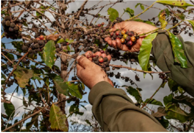
Produção de café em Goiás deve atingir a marca de 263,5 mil sacas na safra 2024

Ao nível nacional, a produção de café deverá alcançar 58,8 milhões de sacas beneficiadas, representando o 3º ano consecutivo de crescimento