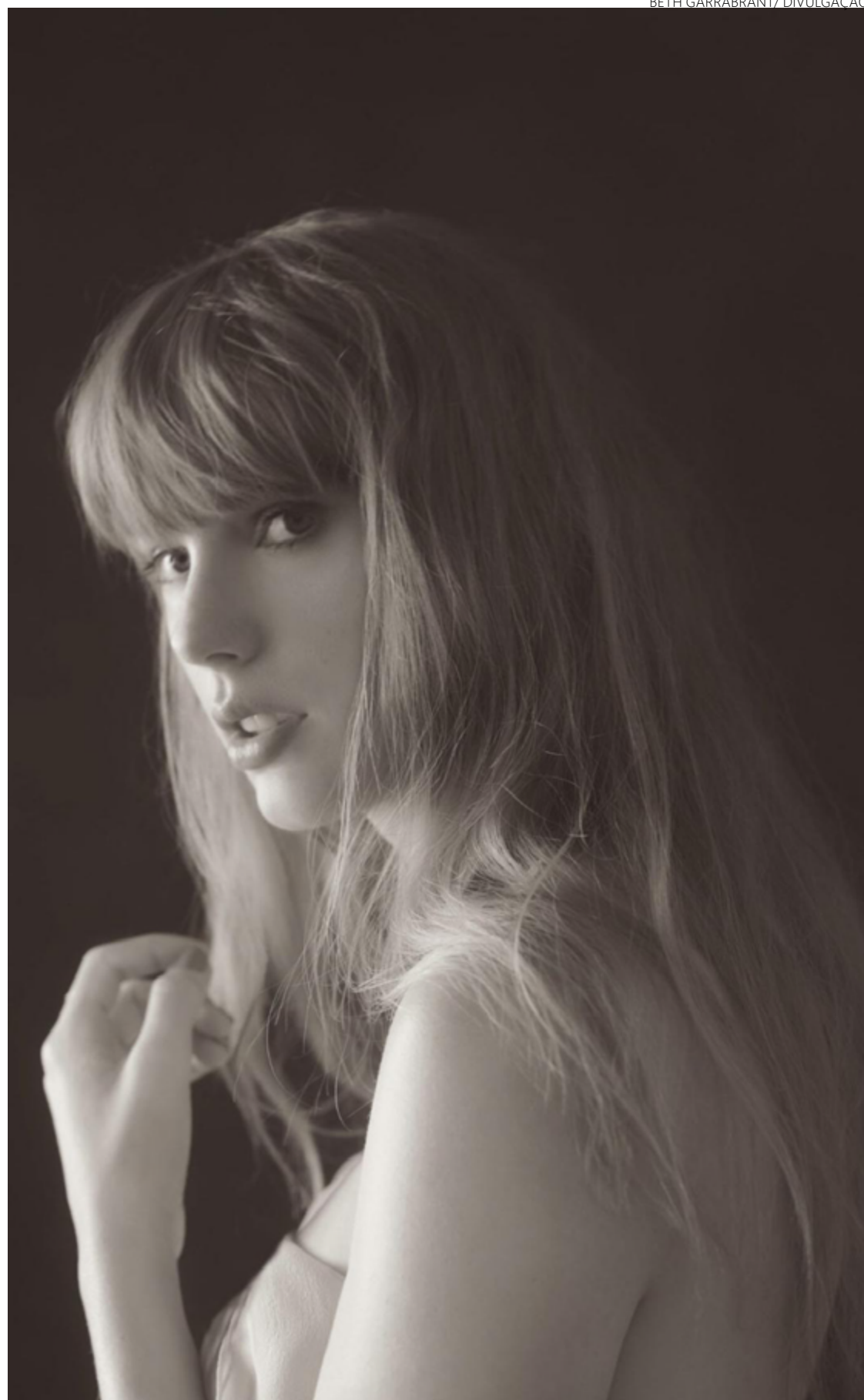
Taylor Swift, espírito do nosso tempo: mais ouvida do streaming

ra fonográfica de Swift começou com o disco "Taylor Swift". Ouve-se nele os elementos pelos quais seria alçada nos anos seguintes à condição de estrela do pop, numa sonoridade - até os anos 2010 - muito influenciada pelo country. O disco abre com "Tim McGraw", na qual se vale da música para evocar memórias, mas já demonstrava aqui e ali a habilidade swiftiana para narrar os sabores de um amor não correspondido.